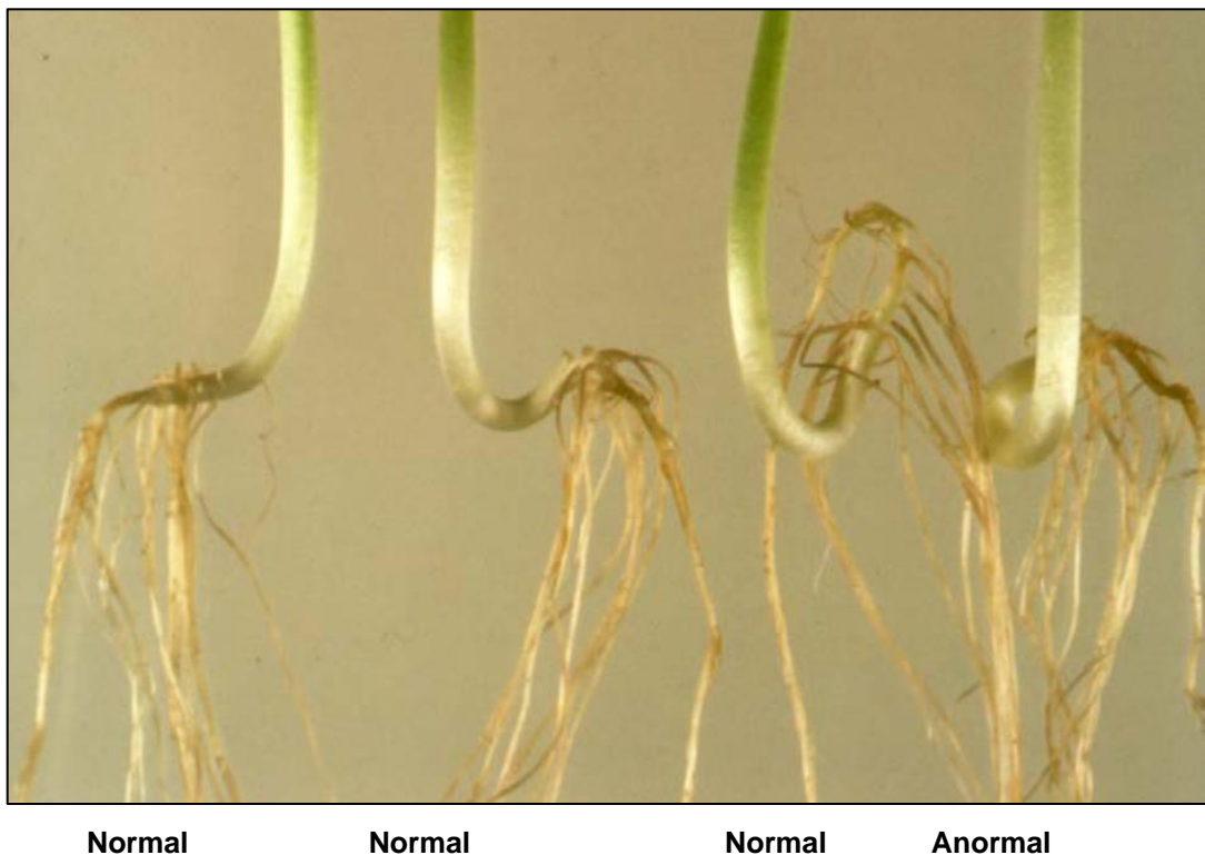
Figura 2. Ilustração de plântulas normais com hipocótilos com laçadas abertas e plântula anormal com laçada fechada.